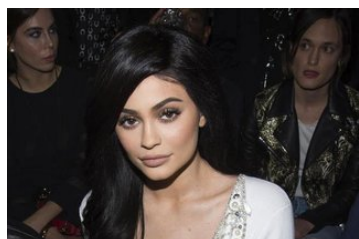
Kylie Jenner verrät Namen ihrer Tochter : Stormi...