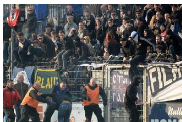
NOFV stellt Antrag auf Strafverfahren gegen...