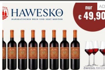
8 Flaschen Rotwein inkl. 4 Weingläser