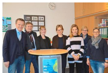
München lernt von Münster : Schul-Integration...