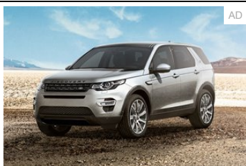
Land Rover Performance-Leasing